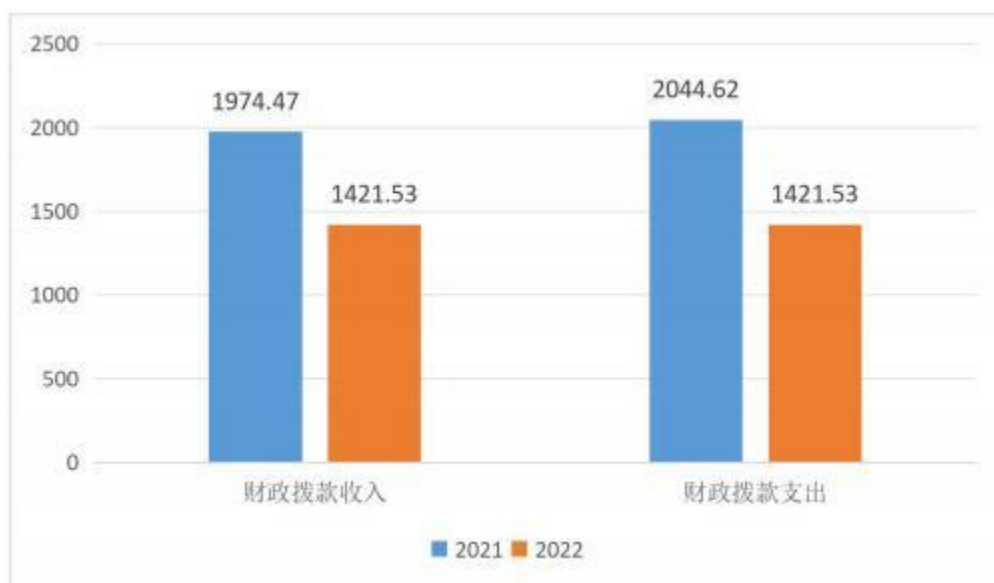
图 2：2021-2022 年财政拨款收支情况（单位：万元）