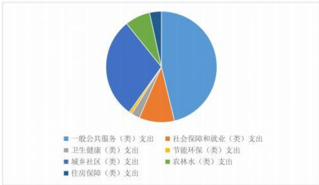
图 4：财政拨款支出决算结构（按功能分类）